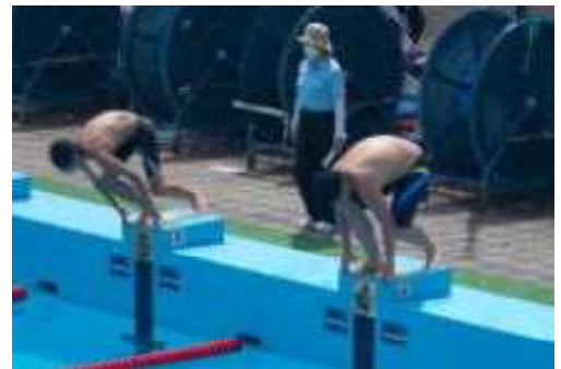
桐生市総合体育大会水泳部

「 習慣は第二の天性 」という言葉があります。特に勉強については、 決まった時間に、きまった場所で取り組むことを心がけさせてほしいです。